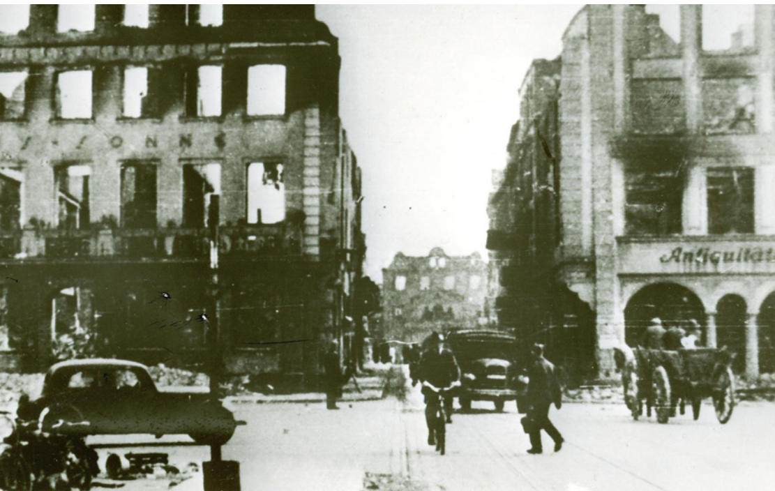
Innerhalb weniger Stunden vernichteten Bomben und Feuer weite Teile der Hansestadt. Mehr als 200 Menschen starben. Zwischen den Ruinen ging das Leben - wie hier am Neuen Markt - weiter.

Was sich in der Nacht zum 24. April ereignete, hatte eine neue Dimension: Fast 150 britische Bomber steuerten auf Rostock zu. Ihre vernichtende Fracht: Spreng- und vor allem Brandbomben. Innerhalb kurzer Zeit prasselten Tausende auf die Stadt nieder und setzten Gebäude in Flammen. Am nächsten Morgen wurde deutlich, dass sich die Schäden in Grenzen hielten. Die meis-