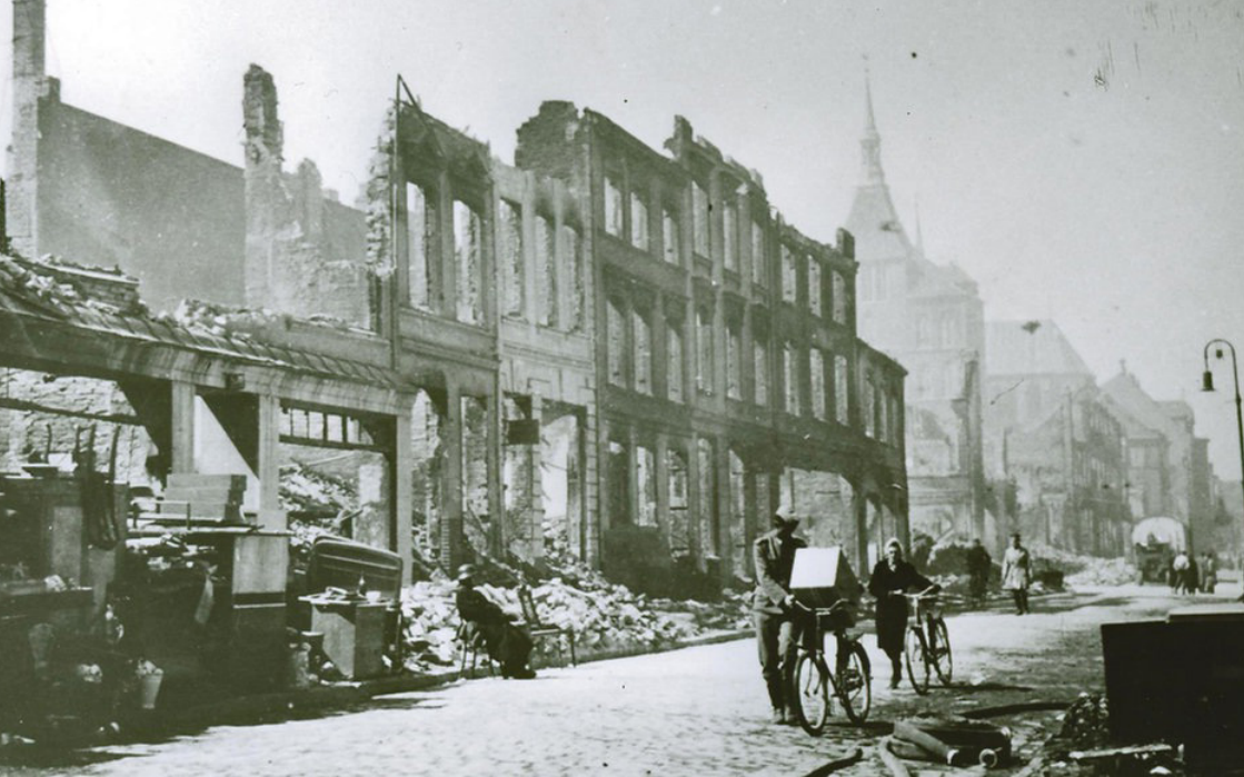
Rostock Ende April 1942: Die britische Luftwaffe hatte in mehreren Nächten die Innenstadt bombardiert und schwere Schäden angerichtet. Tausende Menschen wurden obdachlos und verloren ihr Hab und Gut.