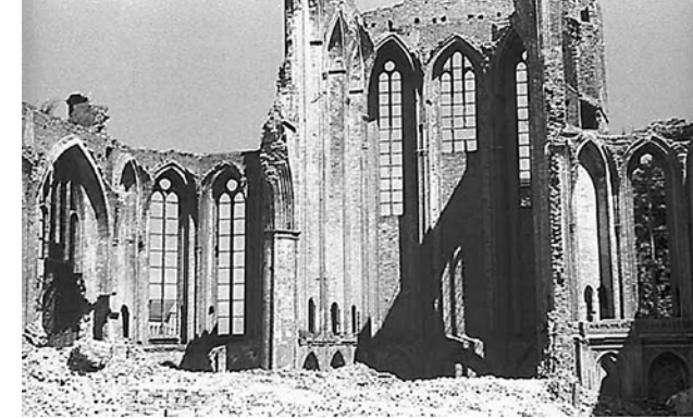
Ruine der Jakobikirche Rostock 1949

Am Kriegsende waren 85 % der Rostocker Wohnungen und 42 % der gewerblich genutzten Gebäude zerstört oder beschädigt. Unter anderem lagen in Trümmern oder waren schwer beschädigt: Die Medizinische Klinik (Gertrudenplatz), Gas- und E-Werk, Post- und Telegrafenamts, Amtsgericht, Oberlan-