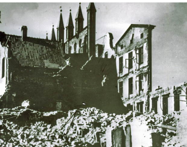
Trümmerberge überall: Von vielen Häusern standen nur noch einzelne Wände. Auch das Rathaus aus dem späten 13. Jahrhundert blieb nicht unversehrt.

von Kliniken und Schulen standen nur noch Ruinen.