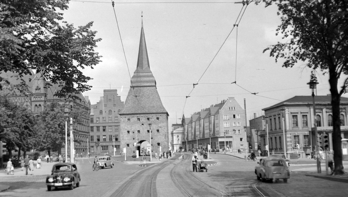
Richard-Wagner-Straße mit Steintor 1962