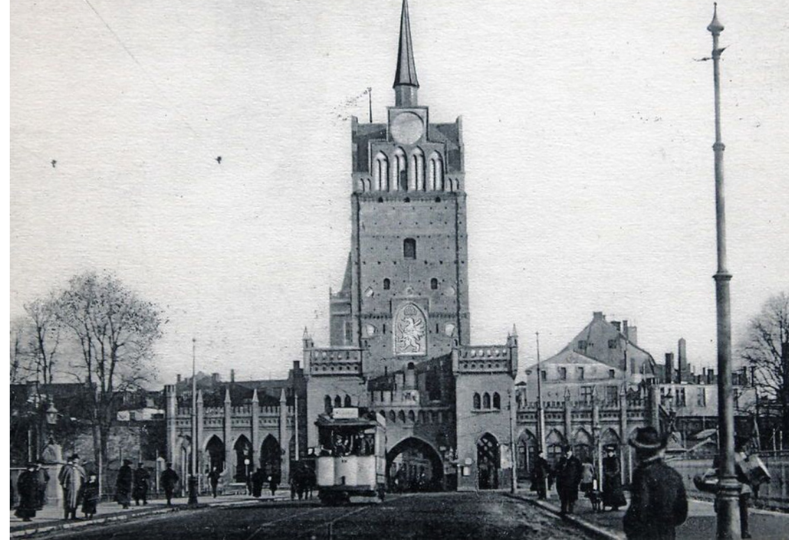
Das Kröpeliner Tor noch mit neugotischen Vorbau, der 1945 ohne Beschädigungen durch den Krieg aus ästhetischen Gründen wieder entfernt wurde. Noch bis 1960 führte eine Straßenbahnlinie entlang der Kröpeliner Straße, durch das Tor und auf einer Brücke über die Wallanlagen zum Doberaner Platz.

Die politische Lage in Rostock sollte sich bald ändern. Ungefähr ab 1923 radikalisierten sich Gruppen im rechten und linken Spektrum. In der „Deutschvölkischen Freiheitspartei“ sammelten sich radikale Rechte in Mecklenburg, in Rostock erschien ihre Parteizeitung. Im Frühjahr 1924 wurde die erste mecklenburgische Ortsgruppe der NSDAP in Rostock gegründet. Die SPD-Fraktion blieb im November 1930 die stärkste Partei in der Bürgervertretung, die NSDAP kam auf den zweiten Platz. Danach änderten sich die Kräfteverhältnisse zu Gunsten der Rechten. Einschüchterungen von Gegnern ließen nicht lange auf sich warten, aggressiv und demonstrativ zeigten die neuen Rechten ihre Präsenz auf den Straßen Rostocks. Welche politischen Positionen in der Gemeinde vertreten wurden,