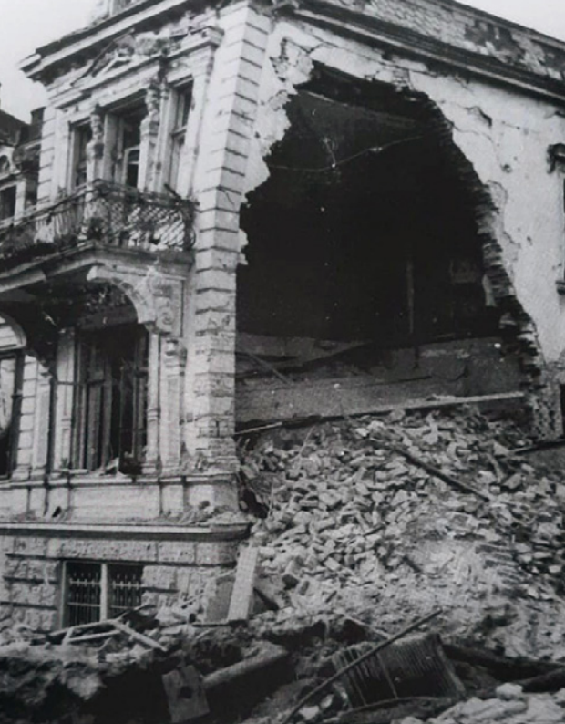
Auch das Haus in der Rosa-Luxemburg-Str. 33 wurde schwer beschädigt.