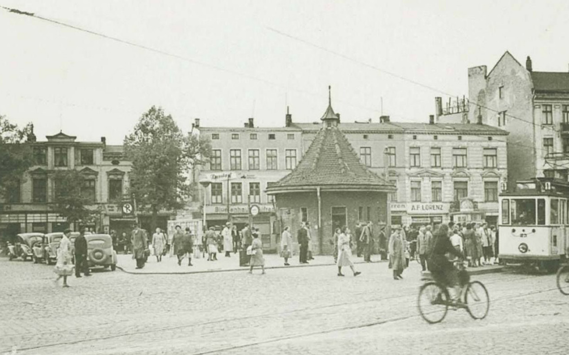
Straßenbild am Doberaner Platz

te, wurde das Stadtgebiet erweitert, es entstanden die Siedlungen Gartenstadt, Stadtweide, Reutershagen, Brinkmansdorf. In der KTV entstanden neue Wohnungen. Zuvor hatte die Stadt noch versucht, zahlreiche Familien durch zwangsweise Belegungen von Wohnungen vor der Obdachlosigkeit zu bewahren.