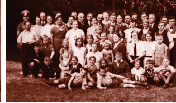
Der Gottesdienstaal in der Hermannstr. 15 vor den zahlreichen Umbaumaßnahmen. Das Bild rechts zeigt eine Aufnahme vom Gemeindeausflug nach Kösterbeck 1955.

“ Wenn es eng wurde, machten sie die große Schiebetür ihres Wohnzimmers auf und schufen so zusätzliche Sitzplätze für die Gemeinde.