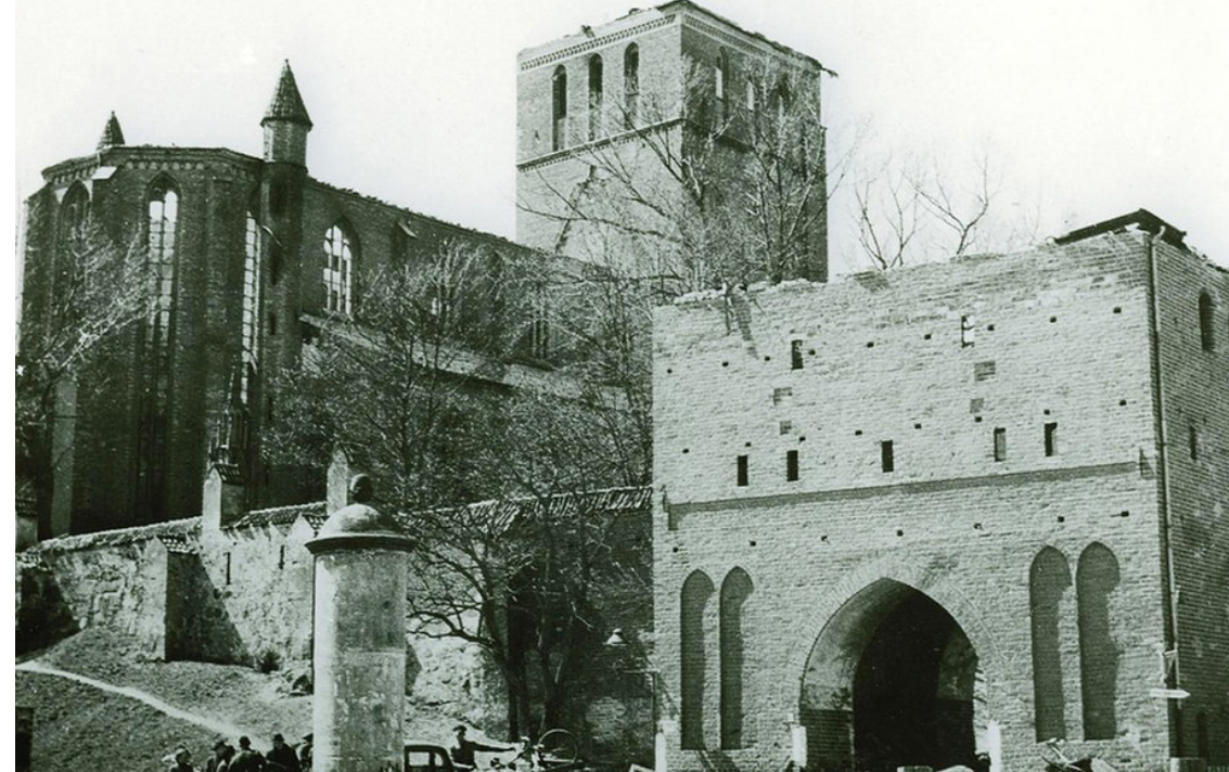
In den großen Kirchen der Hansestadt verbrannten Kunstschätze von unschätzbarem Wert. Die Petrikerche neben dem Petritor verlor ihre 117 Meter hohe Turmspitze.

ten Bomben hatten das Stadtzentrum verfehlt. Die Ordnungspolizei meldete sechs zerstörte Wohnhäuser, sieben Tote und 32 Verletzte. Doch in den folgenden Nächten wiederholten sich die Angriffe. Insgesamt fast 500 Flugzeuge warfen mehr als 100.000 Bomben ab. Jetzt trafen sie auch die Altstadt. Helfende, die die Brände löschen wollten, kamen gegen die Feuersbrunst nicht an. Sie breitete sich von Haus zu Haus aus, erfasste ganze Straßenzüge. Mehr als 200 Menschen starben, Tausende wurden verletzt. Vermutlich wären die Opferzahlen weitaus höher gewesen, wenn die Bevölkerung nicht nach den ersten Angriffen aus der Stadt geflohen wäre. Die Altstadt am Ufer der Warnow